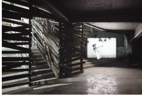
Palais de Tokyo'daki Joachim Koester sergisinden yerleştirme görüntüsü.

Bir başka karanlık sergi mekanı ise, Palais de Tokyo'nun sergi programı dahilinde, Mayıs'ın 20'sine kadar sürecek solo sunumunda, Joachim Koester'e ait. Sanatçı, insan doğasının vahşi yanını, rüya ile gerçekliğin