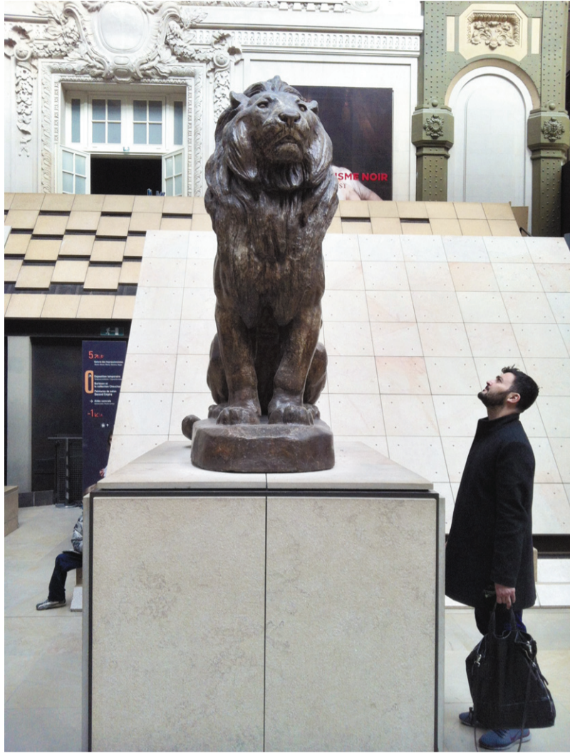
Musée d'Orsay'da gezerken...

Rumi'de düğümleniyor: "Zulüm demiriyle taşıyı birbirine vurma! Çünkü bu ikisi, erkek ve kadın gibi çocuk meydana getirirler."