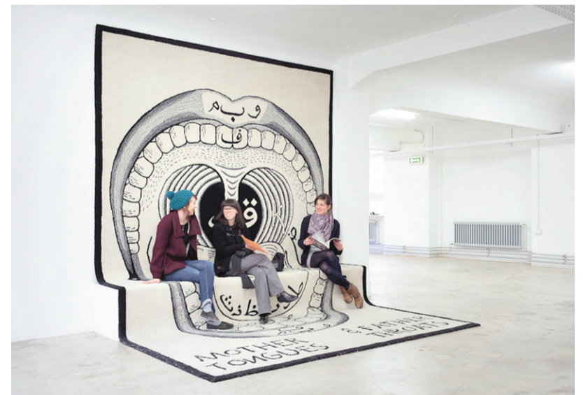
SAHA, Künstlerhaus Stuttgart'ın 2013 sergi programında, sanatçı araştırmalarını ve mekana deneysel yaklaşan projeleri destekliyor. Slavs and Tatars'ın "Mother Tongues and Father Throats" (2012) isimli çalışması, "Behind Reason" başlıklı sergilerinin girişinde.

MÇ: Sürdürülebilirlik ve devamlılık, hem bizim açımızdan hem de ekosistemin diğer paydaşları açısından çok önemli. Gelecekte diğer oluşumlar kadar bizim de varolmaya ve evrilmeye devam etmemiz gerekiyor. Görünür olma fikrinin ötesinde görünür kılmak ve üretime olanak sağlamakla ilgileniyoruz ve bu kapsamdaki projelere destek vererek, kurumlara işbirlikleri yaparak, somut eser üretiminin yanında düşünce