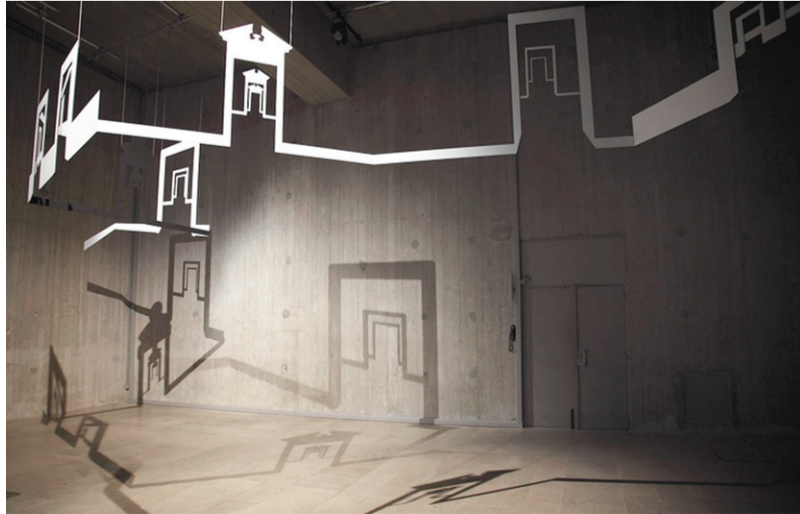
Louvre'daki Walid Raad sergisinden yerleştirme görüntüsü.

projeksiyonlardan geri yansıyan anlarda kendimize dönüyoruz. Sergi ellilerin başından, İngiliz ordusundan bir hikaye ile sonlanıyor. Bu, eşcinsel olduğu için yargılanan ve ordudan atılan, daha sonra gizemli bir şekilde ölen; psikoloji biliminde en önemli yapıya zeka referanslarından Turing'e adanmış bir çalışma. Tarihten bir başka karanlık sayfa. Son olarak, Louvre'da gerçekleşen Walid Raad sergisini atlamak mümkün değil. Paralel bir yayım ile sunulan "Preface to the First Edition" isimli projede, Raad 18. Yüzyılda ortaya çıkan "evrensel müze" kavramına odaklanarak, süreci geleceğin müzesini hayal etme çalışmaları üzerine kuruyor. 2014'te açılacak Louvre Abu Dhabi'de sergilenmek üzere, Paris'teki Louvre'dan gidecek İslam sanatları koleksiyonunun bu göçten sadece iklim açısından, fiziksel olarak değil, aynı zamanda psikolojik, kavramsal ve bağlamsal olarak nasıl etkileneceği üzerine görsel senaryolar geliştiriyor. Gölgeler, yansımalar ve optik yanılsamalarla işleyen bu karanlık yerleştirme, Raad'ın Orta Doğu modern sanat tarihi odaklı diğer çalışmalarıyla örtüşen bir kavramsal çizgide... 2014'te Abu Dhabi'de gerçekleştirilecek Louvre açılışının kurgusal senaryosunu yazarak, müzede thriller etkisi yaratıyor.